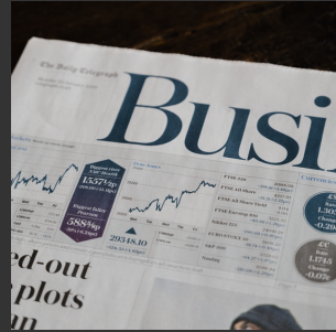
صناديق سوق المال

-صندوق إتقان للمرابحات والصكوك -الاستثمار المباشر في صندوق المربحة