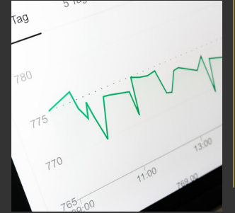
صناديق الاستثمار في الأسهم

- شعبه (٢/٣ /١) - صندوق إتقان للأصول العقارية -صندوق إتقان السكني